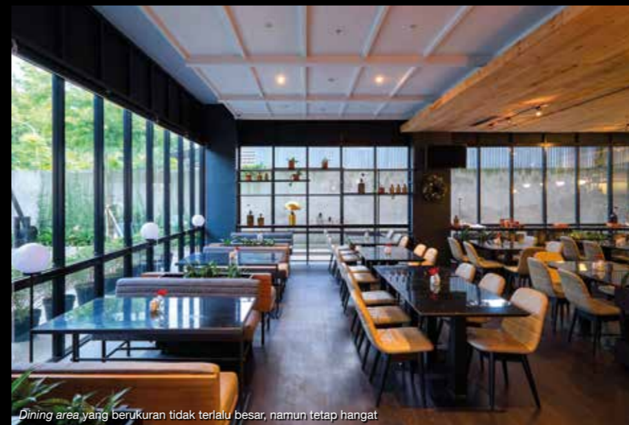
Dining area yang berukuran tidak terlalu besar, namun tetap hangat