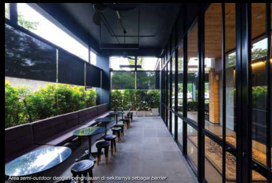
Area semi-outdoor dengan penghijauan di sekitarnya sebagai barrier