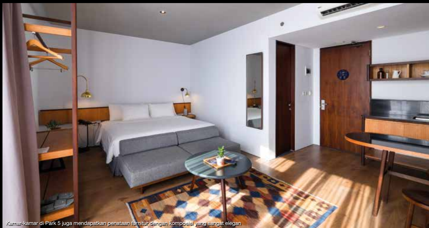
Kamar-kamar di Park 5 juga mendapatkan penataan furnitur dengan komposisi yang sangat elegan

alami masuk pada siang hari. Tanaman gantung diletakkan di balkon masing-masing kamar sehingga menyerupai taman mini yang dapat dinikmati tamu dan penduduk sekitar. Kolam renangnya terletak di tengah dua bangunan utama dan menjadi celah bagi ruangan yang ada untuk "bernapas".