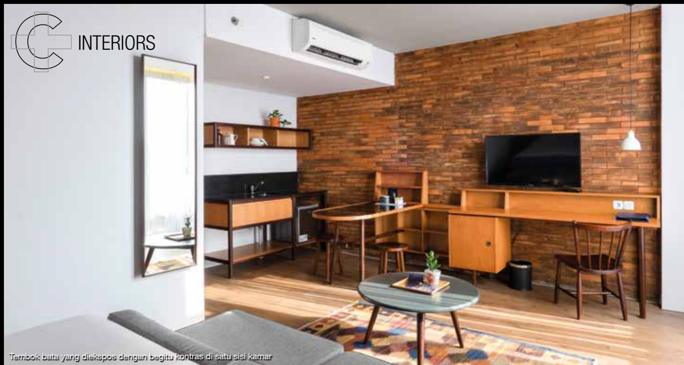
Tembok bata yang diekspos dengan begitu kontras di satu sisi kamar