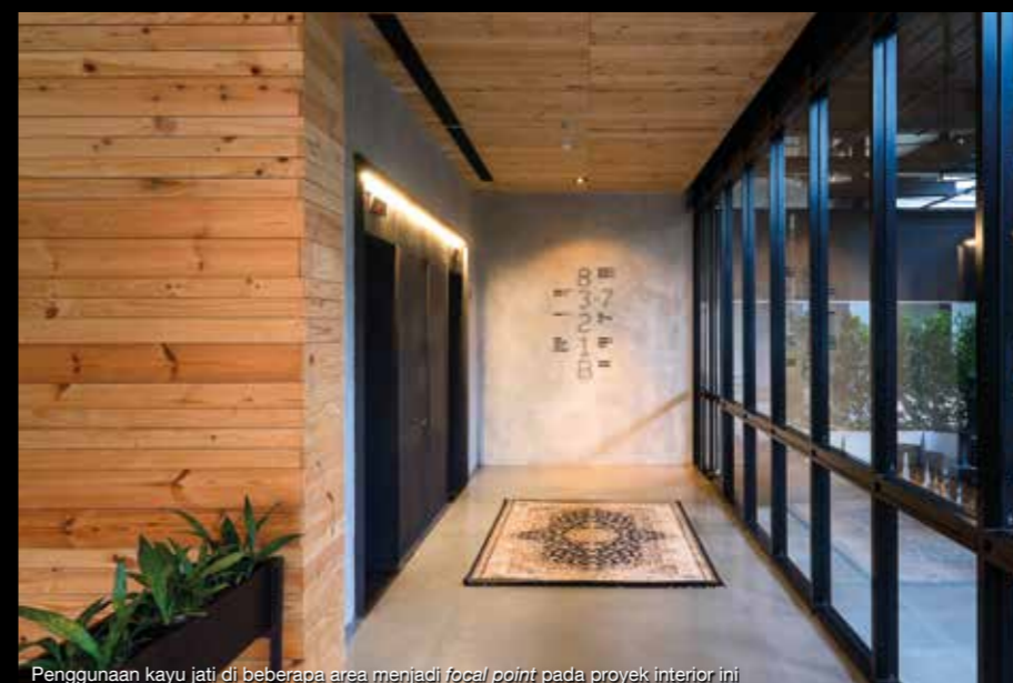
Penggunaan kayu jati di beberapa area menjadi focal point pada proyek interior ini