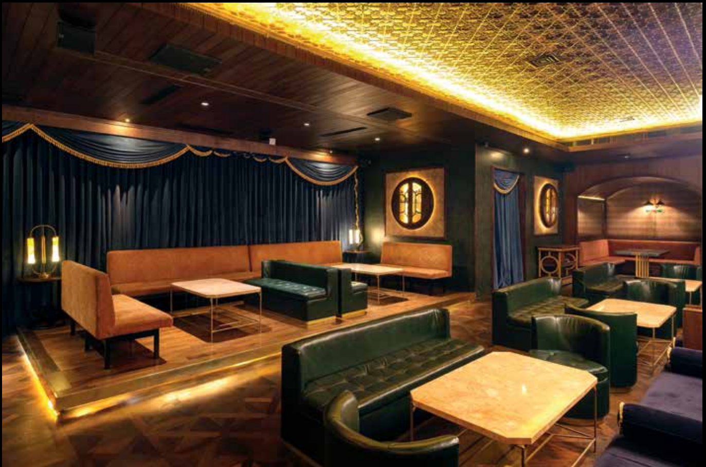
Area panggung yang juga dapat menjadi area duduk

Beberapa material yang digunakan meliputi dark wood jenis walnut , logam seperti kuningan, hingga permainan berbagai jenis dan motif fabric . Seperti sudah menjadi ciri khas Bitte Design Studio, detail ornamen pun menjadi perhatian khusus, dari pemilihan material fabric berupa blue velvet dengan detail patterned , cat tekstur hijau gelap, padded wall , serta berbagai elemen dekorasi berupa rustic mirror hingga gipsum cetak yang memperkuat ambiance teatral.