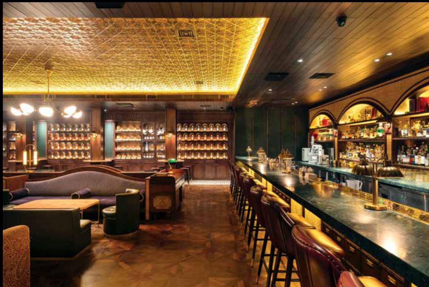
Bar sepanjang 10 meter yang dapat dilihat dari segala area

Konsep ini diimplementasikan secara menyeluruh pada A/A Bar, diawali dari desain kulit luar bar dan pintu masuk yang jauh dari kesan gemerlap, namun memancarkan daya tarik misterius. Pada area entrance , terdapat rak buku berlatar belakang rustic mirror yang ternyata merupakan kamufase pintu masuk, di mana pengunjung perlu menemukan buku yang tepat untuk membuka pintu tersebut.