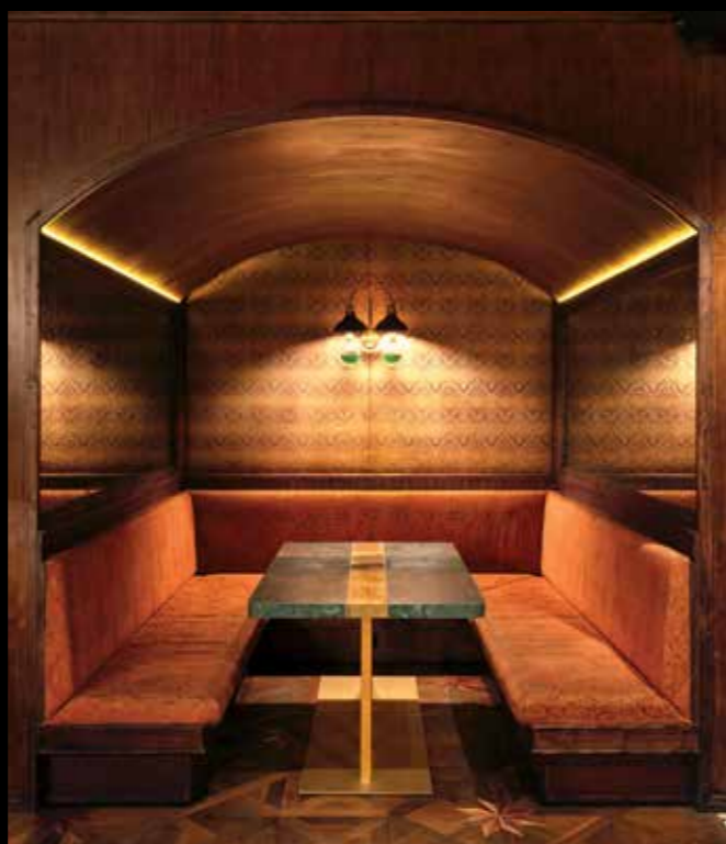
Seating booth didesain dengan unik serta sangat nyaman

Dengan kapasitas tempat duduk eksklusif mencapai 120 orang, Bitte Design Studio memberikan sentuhan intim pada proyek ini melalui detail material dan ornamen custom made pada keseluruhan elemen interior, baik lighting fixture hingga furnitur. Untuk mengangkat ambiance di masa itu, dilakukan riset dan hunting material untuk mendapatkan yang sesuai.